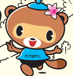
ぼんちゃん(館林市)