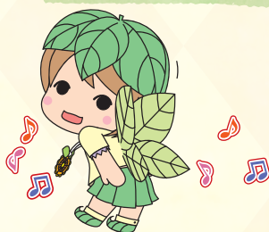
みどりちゃん(千代田町)

両毛地域は非常にバラエティー豊富な地形となっています。北に足尾山地がそびえ、南には日本一の広さを誇る関東平野が開けています。地域の中央には渡良瀬川が流れ、南端は利根川と接する、緑と水に恵まれた地域です。古来より文化・経済の結びつきが強く、盛んな交流が続いています。