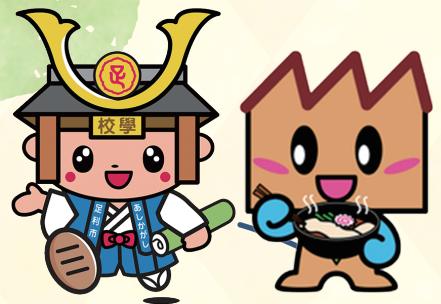
たかうじ君(足利市) キノピー(桐生市)